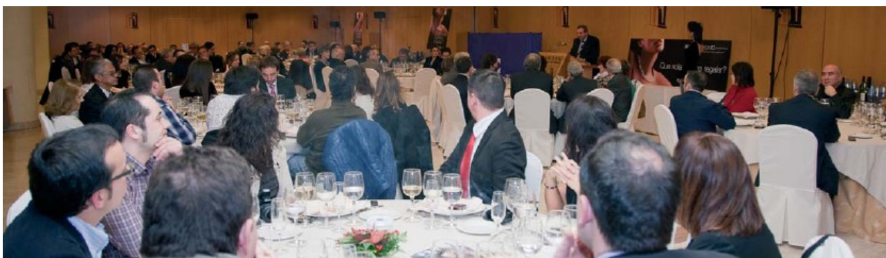
Imagen general del salón.

Este evento pretende convertirse en encuentro habitual de los profesionales del sector, trasladándose a distintos puntos de Galicia en años venideros.